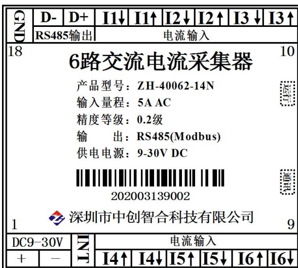
图 5.2 6 路电流输入引脚定义图