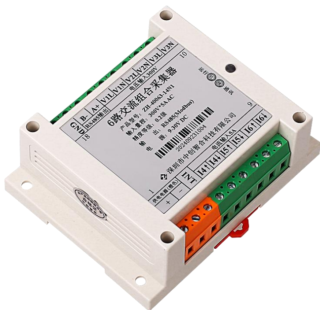
图 4.1、外观图（导轨安装）