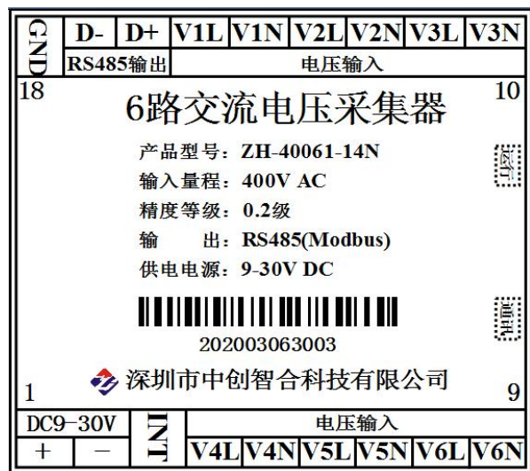
图 5.1 6 路电压输入引脚定义图